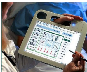
Σύγχρονος ιατρικός φάκελος

Μέσα από ένα εύχρηστο και γρήγορο περιβάλλον εργασίας πετυχαίνει την άμεση και ορθολογικότερη παρακολούθηση της κίνησης ασθενών, θεραπειών, συνεργατών, αγαθών, αποθηκών, καθώς και όλων των παραγόμενων εξ' αυτών ιατρικών και διαχειριστικών πληροφοριών, με οφέλη τόσο τη μείωση του φόρτου εργασίας του προσωπικού όσο και τη λήψη καλύτερων αποφάσεων από τη διοίκηση.