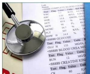
Χρήση διεθνών κωδικοποιήσεων